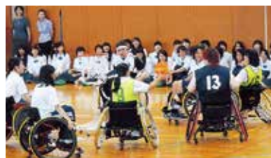
家庭クラブ講演会 「障害を乗り越え、今を生きる」