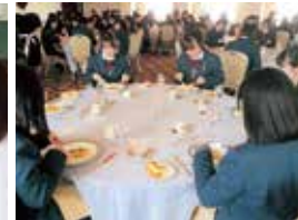
テーブルマナー講習会