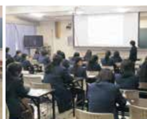
職業ガイダンス(1年)