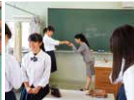
接遇マナー講習会