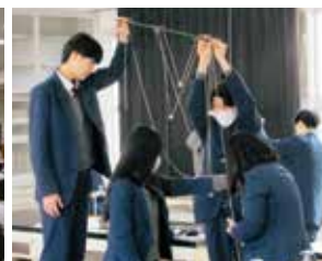
産学連携講座(本多電子)