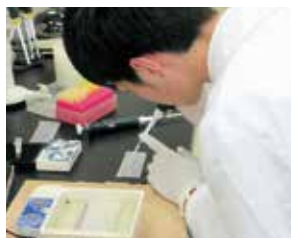
高大連携実験実習講座 (豊橋技術科学大学)

普通科では、生徒の自発的な科学研究活動の取り組みをサポートしています。豊橋技術科学大学・本多電子との連携実験実習講座など、大学や企業との共同で最先端の科学に触れる授業を行っています。