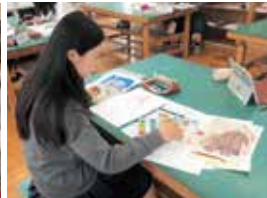
デザイン画講習会