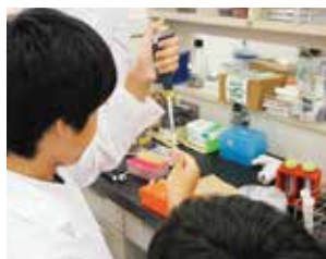
高大連携実験実習講座 (豊橋技術科学大学)

普通科では、生徒の自発的な科学研究活動の取り組みをサポートしています。静岡大学・豊橋技術科学大学・本多電子との連携実験実習講座など、大学や企業との共同で最先端の科学に触れる授業を行っています。