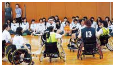
家庭クラブ講演会 「障害を乗り越え、今を生きる」