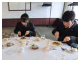
テーブルマナー講習会