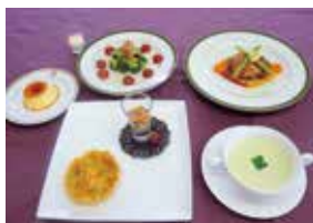
食物調理技術検定I級作品