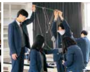
産学連携講座(本多電子)