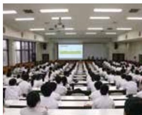
高大連携実験実習講座(静岡大学)