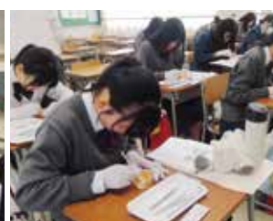
模擬授業(生活文化科)