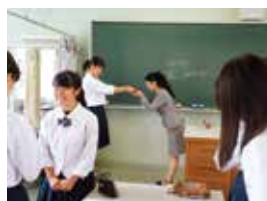
接遇マナー講習会