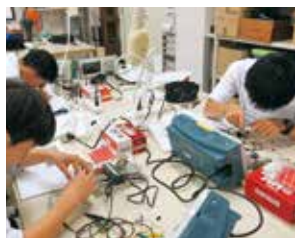
高大連携実験実習講座(静岡大学)