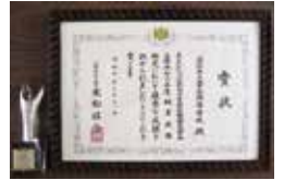
秘書検定 文部科学大臣賞