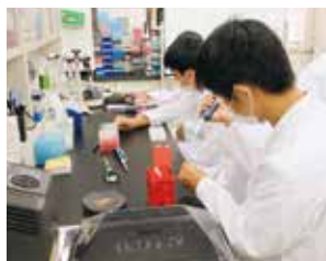
高大連携実験実習講座 (豊橋技術科学大学)

普通科では、生徒の自発的な科学研究活動の取り組みをサポートしています。静岡大学・豊橋技術科学大学・本多電子との連携実験実習講座など、大学や企業との共同で最先端の科学に触れる授業を行っています。