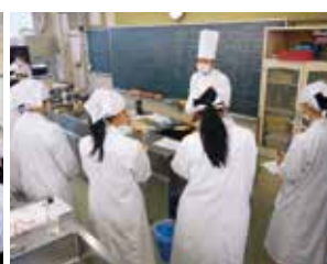
模擬授業(生活文化科)