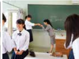
接遇マナー講習会