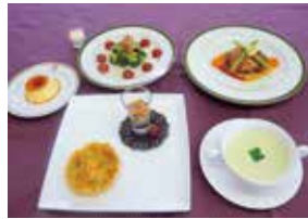
食物調理技術検定1級作品