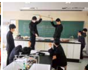
産学連携講座(本多電子)