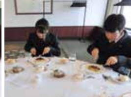
テーブルマナー講習会