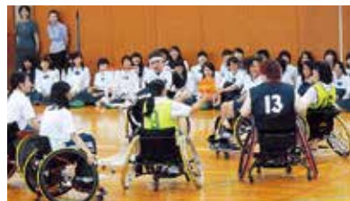
家庭クラブ講演会 「障害を乗り越え、今を生きる」