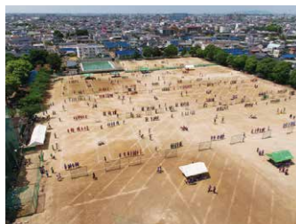
初夏の風物詩にもなっている球技大会

クラスが一致団結してヒートアップする豊丘名物「球技大会」と「合唱コンクール」。多くのバレーボールコートがグラウンドを埋め尽くす圧巻の光景、繰り広げられる熱戦の数々、想いをひとつにして歌い上げ、なんだか心ふるえたりする瞬間…熱い青春がココに。