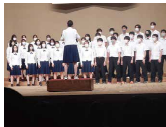
3年ぶりにアイプラザ豊橋で開催された2022年度の合唱コンクール