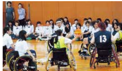
家庭クラブ講演会「障害を乗り越え、今を生きる」