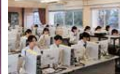
ビジネス文書実務検定