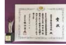
秘書検定文部科学大臣賞