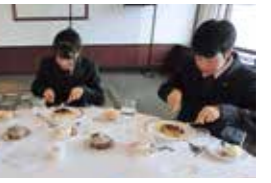
テーブルマナー講習会