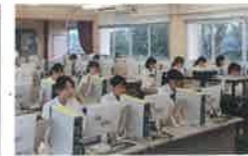
ビジネス文書実務検定