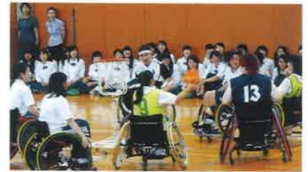
家庭クラブ講演会「障害を乗り越え、今を生きる」