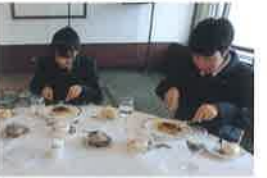
テーブルマナー講習会