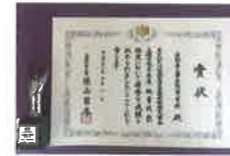
秘書検定文部科学大臣賞