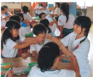
インターンシップ(幼稚園・保育園実習)